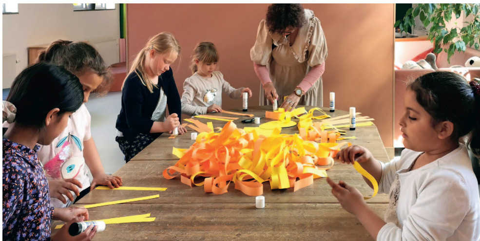
Pinsesolen dansede på alléen ned til friluftsgudstjenesten 2. pinsedag. Solene blev lavet af 0-klasserne og deres sole var med til at sætte et festligt præg på dagen.

I årtier er det en opgave, som i høj grad er blevet varetaget af dem, som vi kalder de frie kirkelige organisationer, som eks. KFUM, Kirkens Korshær, etc. Men mange af dem lider under dalende tilslutning, og den stigende grad af institutionalisering, som i høj grad reducerer dem til en forlængelse af enten kommune eller region. Det er på mange måder en styrke, men med de diakonale briller, så rummer det også en svaghed, for med den form for institutionalisering forsvinder ånden hurtigt, og samme går både spontanitet, fleksibilitet og i værste fald også nærværet.