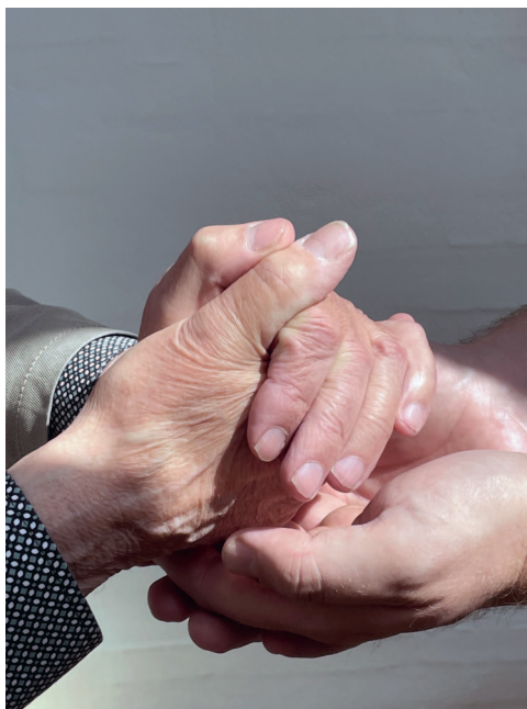
I kirkelig regi skal vi turde, at tage hånd om hinanden.

ansvar. Diakonien er et kirkeligt begreb og det er først og fremmest kirkens ansvar, at diakoni praktiseres der, hvor vi også forkynder evangeliet. Det er rart, når universiteter og det øvrige civilsamfund bidrager til projektet, men ansvaret for diakonien er nu engang kirkens.